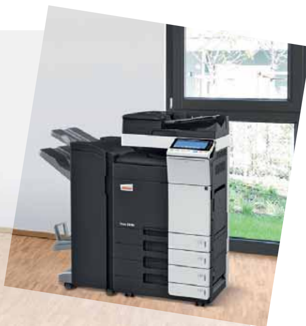
ineo 364e mit Dual Scan Originaleinzug (DF-701), Heft- und Broschürenfinisher (FS-534SD) und Papierkassette (PC-210)