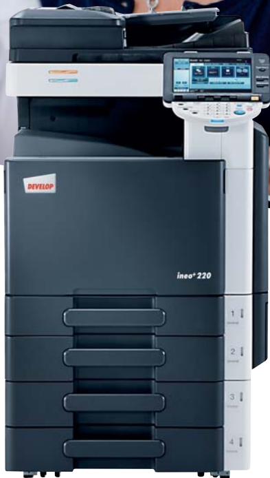
ineo+ 220 mit Originaleinzug (DF-617) und 2x 500 Blatt Papierkassette (PC-207)