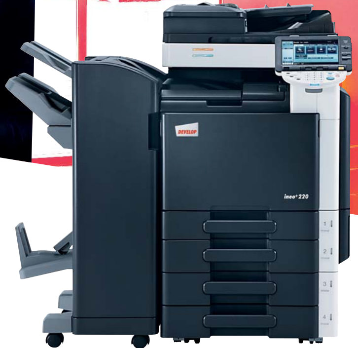
ineo+ 220 mit Originaleinzug (DF-617), Standfinisher (FS-527), Rücksticheinheit (SD-509) und 2x 500 Blatt Papierkassette (PC-207)