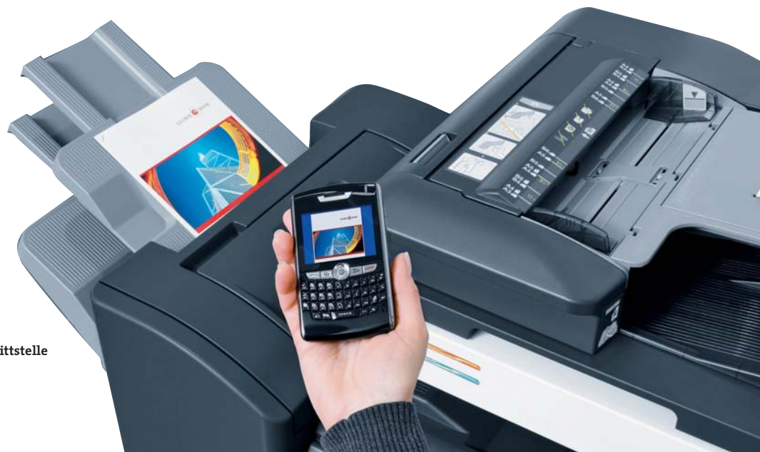
Mobiles Drucken über optionale Bluetooth-Schnittstelle